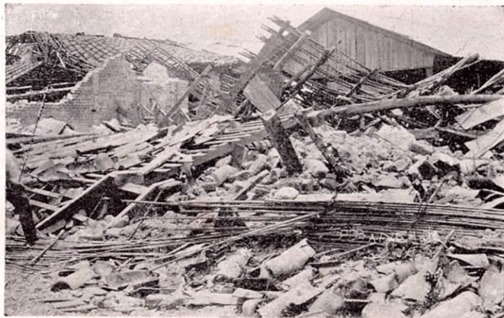
Escombros en Cartago