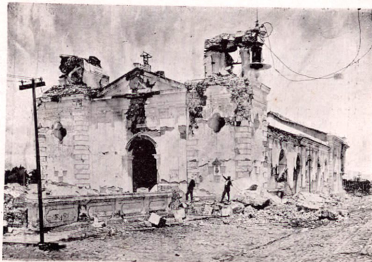
Iglesia de San Francisco (Cartago)