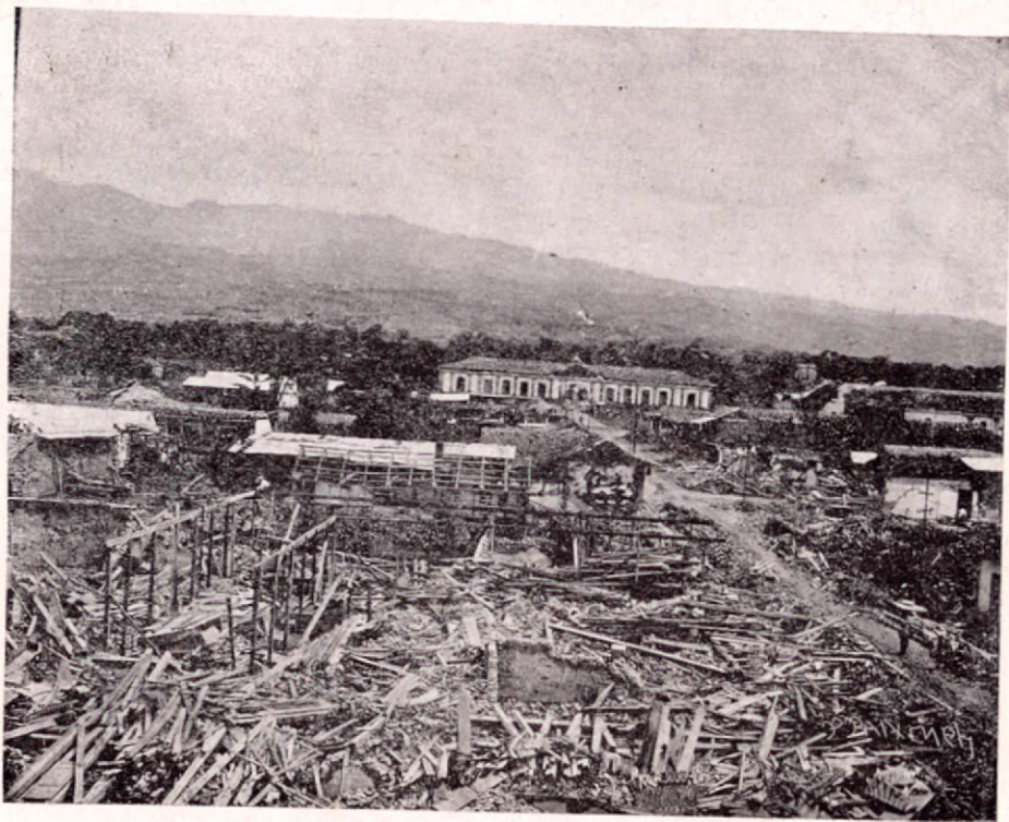
Vista de Cartago después del terremoto

—Debes proponer las cinco de la madrugada.