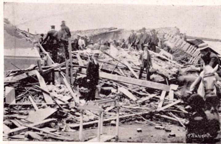
Escombros de una casa en Cartago