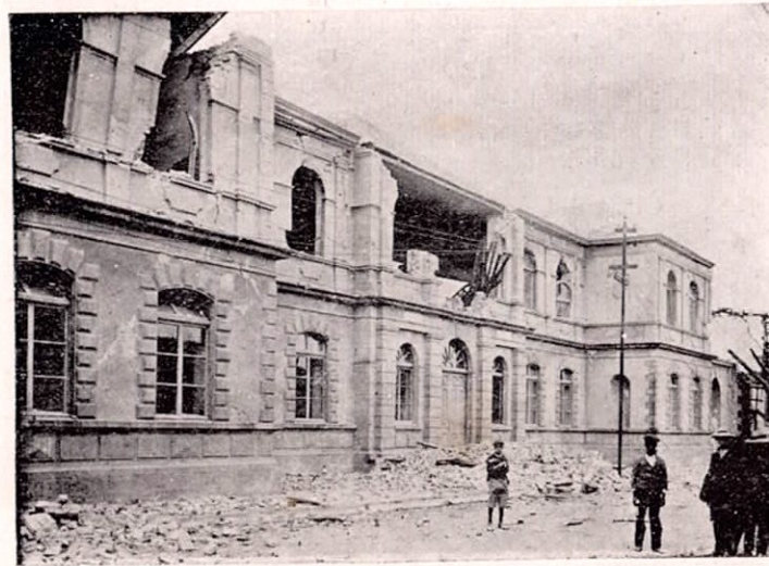
Edificio de las Escuelas Primarias de Cartago destruido por el terremoto del 4 de Mayo

—Si tal véis, á qué vuestra pregunta? Porque con verdad os hablo